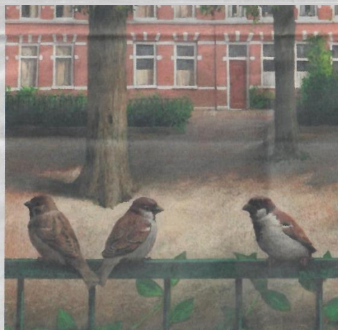
Ton van Steenbergen, Koningsplein, tempera, 30 x 25 cm

Het was inderdaad de bedoeling van de jubilerende Maranathakerk de kunstenaars te verleiden juist die stadswijken in te trekken waar ze normaal nooit komen. Want 'gewone' Haagse stadsgezichten in verf of inkt, dat zijn meestal geijkte afbeeldingen van het centrum: het eeuwige Binnenhof, het sfeervolle Lange Voorhout, de Gevangenpoort. Ook mooi, maar wel een tikje eenzijdig. Het kunstproject