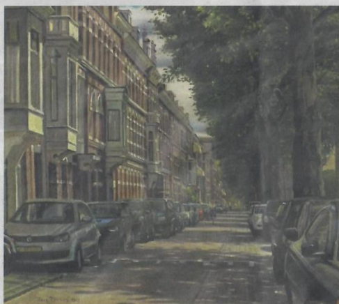
Titus Meeuws, Conradkade, olieverf, 45 x 55 cm