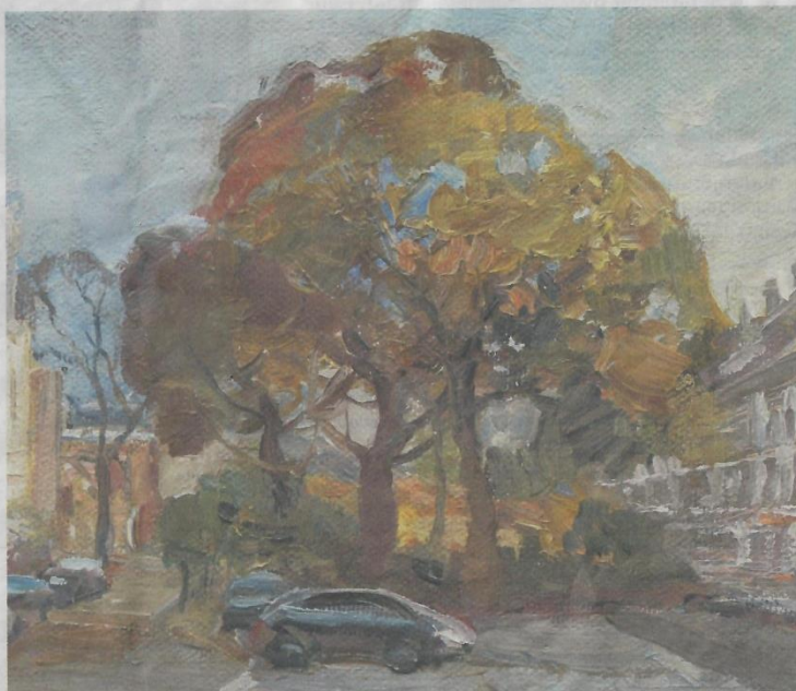
Natalia Dik, Sweelinckplein II, olieverf, 15 x 15 cm