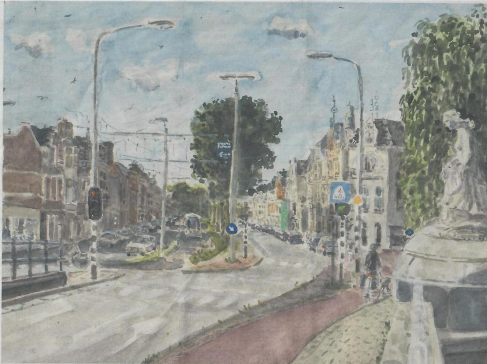
Joanna Quispel, Laan van Meerdervoort, Den Haag, aquarel

de druilrige regen, om elke wisseling van licht en schaduw vast te leggen. De variatie van wat ze gemaakt hebben, is enorm. Het formaat van de schilderijen wisselt ook. Er zijn breekbare, sfeervolle miniatuurtjes bij. Andere doeken zijn fors.